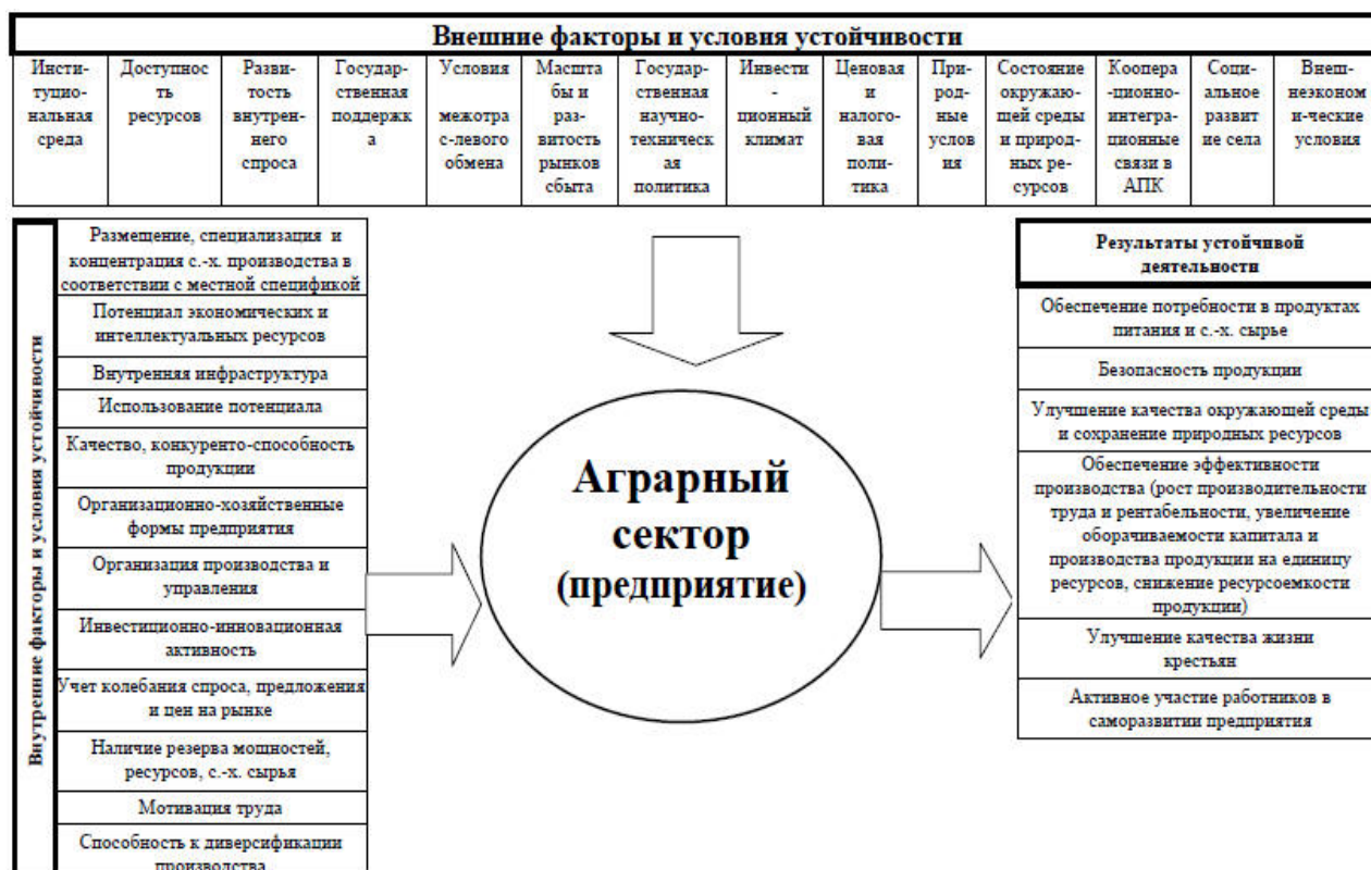
Рис. 2. Факторы и условия устойчивости аграрного предприятия (сектора)

Для количественной характеристики устойчивости сельскохозяйственного предприятия используется система показателей, представленная на рисунке 3.