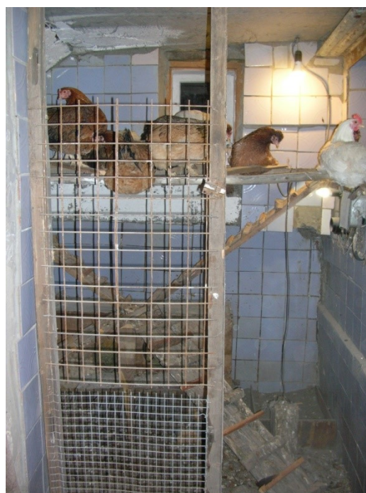
Рис. 3. Пример размещения элементов оборудования для кур-несушек

5. Модуль помещения и оборудование для кур-наседок. Для наседок подходит любое гнездо, но необходимо подумать о цыплятах в период их вывода. Если наседка находится под постоянным наблюдением и мы отнимаем цыплят по мере их вывода, то наседка выведет цыплят и в обычном гнезде. Но такой подход нерационален. Наседка сама вполне справится со всеми проблемами. При конструкции гнезда учитываются особенности поведения цыплят и наседки в период вывода.