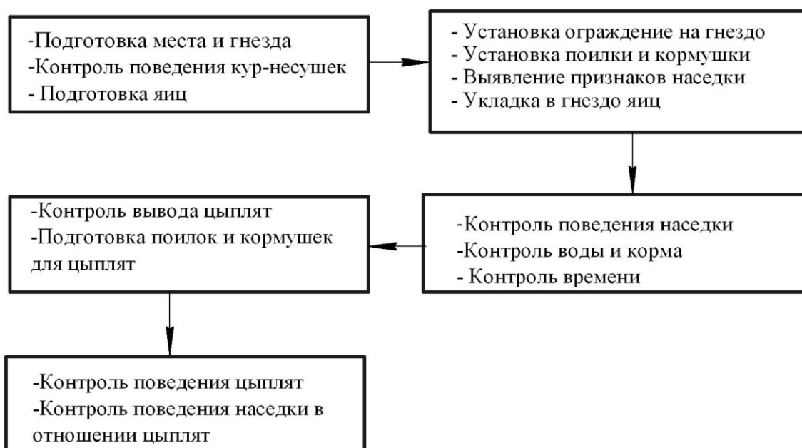
Рис. 2. Алгоритм локальной технологии содержания кур-несушек с воспроизводством при использовании кур-наседок

находиться практически в течение всего светового дня. Наличие дополнительной открытой площадки с естественным травяным покровом позволяет в теплый период решить вопрос с микроэлементами и витаминами. В стенах помещений сделать проемы с дверцами для обеспечения возможности свободного выхода птицы в вольтер и на площадку. Во всех местах нахождения птицы установить кормушки и поилки. Следует учесть, что кормушки, устанавливаемые на открытых площадках, должны не позволять дикой птице и грызунам поедать корм. В общем технологическом процессе особое место занимает локальный процесс воспроизводства. Локальная технология содержания кур-несушек с воспроизводством с использованием кур-наседок по замкнутому циклу представлена в виде простейшего алгоритма (рис. 2). В алгоритме отражены качественно-количественные изменения на каждом этапе взаимодействия механизмов с биологическими объектами.