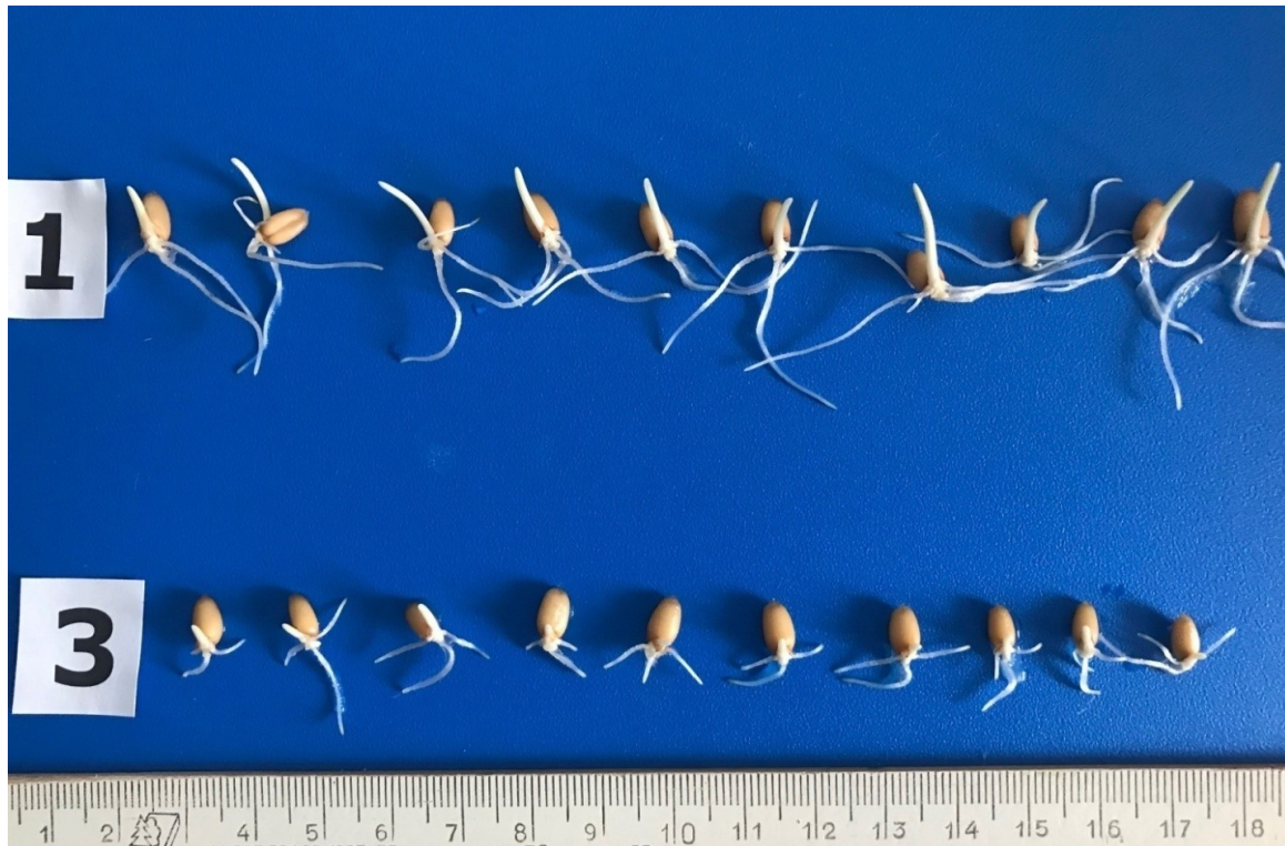
Рис. 3. Трехсуточные проростки семян яровой пшеницы сорта Дарья: 1 – стандарт; 3 – исследуемые семена Б