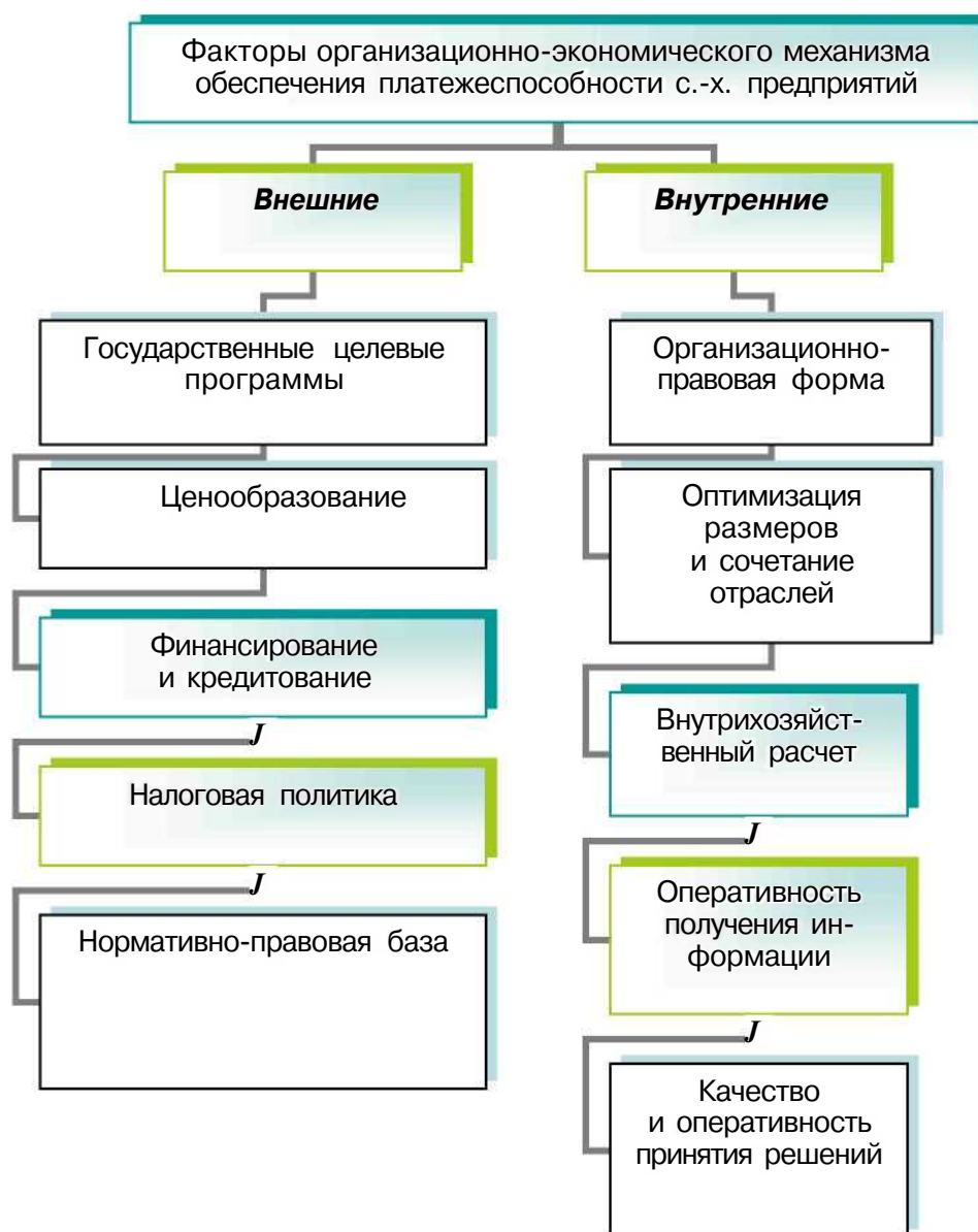
Рис. 2. Структура факторов организационно-экономического механизма АПК