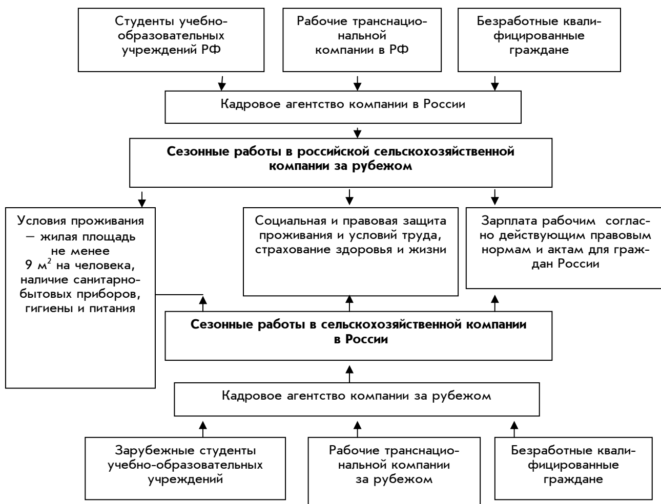
Рис. 1. Схема транснациональной системы обеспечения трудовыми ресурсами сельскохозяйственного производства

Исходя из показателей таблицы, видим, как начиная с 1993 г., происходит ежегодное снижение общей численности населения России [2]. При этом количество занятого населения в сельском хозяйстве, охоте и лесном хозяйстве в 2009 г. по сравнению с предыдущим годом уменьшилось на 9,8%, или на 281 тыс. чел., и данная тенденция сохраняется на протяжении последних лет (рис. 2).