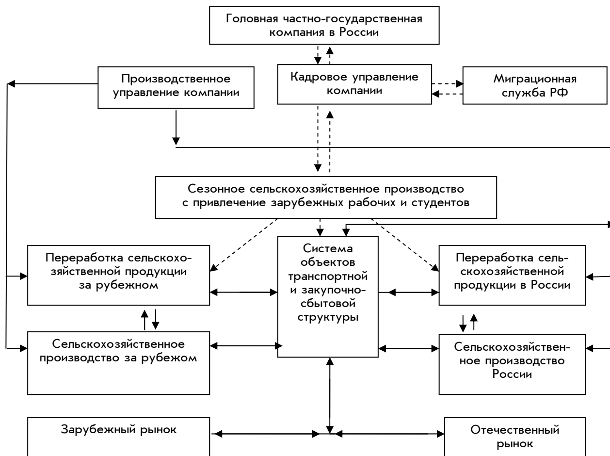
Рис. 3. Схема диверсификации производства частно-государственной сельскохозяйственной компании в экономику развивающихся стран