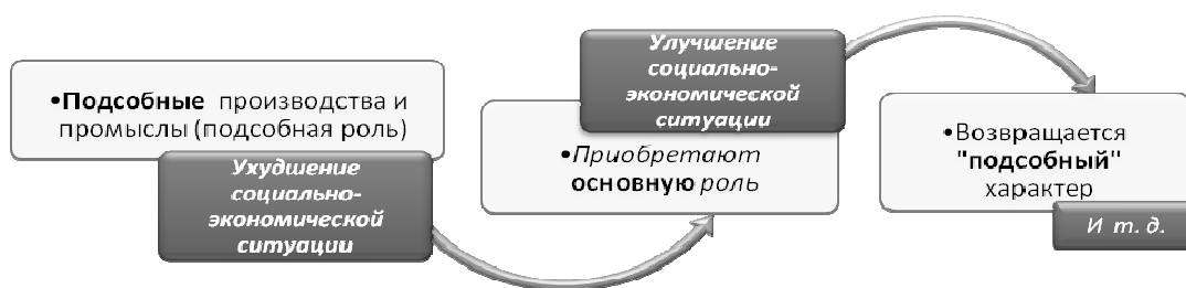
Рис. 2. Цикличная экономическая трансформация функционального значения подсобных производств и промыслов

Таким образом, мы предлагаем следующую классификацию подсобных производств и промыслов (рис. 1).