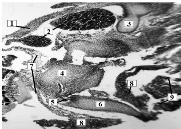
Рис. 1. Внутренние органы брюшной полости зародыша марала (30 сут.).

В конце зародышевого этапа развития (30 дней) у маралов в брюшной полости наблюдаются начало поворота первичной кишки, дифференциация зачатков желудка, печени, поджелудочной железы, кишечника, увеличивается аллантаис (рис. 1). Желудок очень маленький, расположен между правой и левой долями печени. Среди камер более выражены рубец и сычуг, слегка смещены влево от срединной сагиттальной плоскости. На рубце уже намечены слепые выступы. Тело сычуга вытянуто, по своей длине почти одинакового диаметра (3,2±0,15 мм), пилорус хорошо выражен.