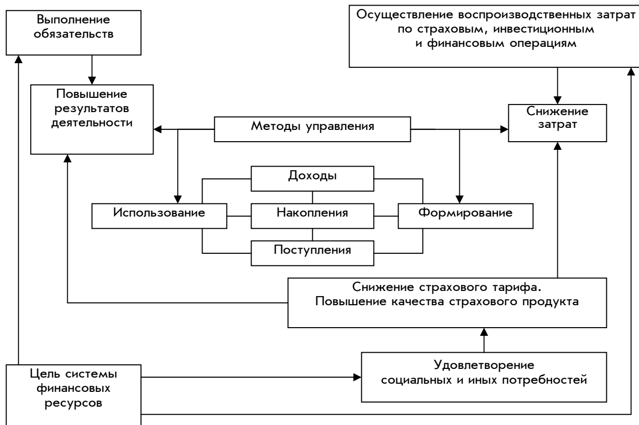
Рис. 1. Взаимодействие элементов по достижению цели системы финансовых ресурсов страховой компании

- повышения уровня удовлетворения социальных и иных потребностей, что связано со снижением страхового тарифа (за счет снижения затрат) и повышением качества страхового продукта (за счет повышения результатов деятельности).