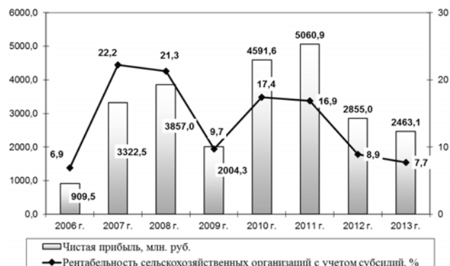
Рис. 3. Показатели экономической эффективности деятельности сельскохозяйственных товаропроизводителей Алтайского края в 2006-2013 гг.

лочного скотоводства увеличилась в 1,7 раза. Такое соотношение приводит к формированию низкой доходности отрасли и снижению ее инвестиционной привлекательности.