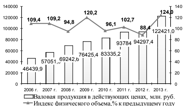
Рис. 1. Производство продукции сельского хозяйства в Алтайском крае в 2006-2013 гг.

Стоимость произведенной сельскохозяйственной продукции в 2013 г. составила 122,4 млрд руб., индекс производства сложился на уровне 124% (по Российской Федерации – 106,2%), что на 35,6% выше, чем в 2012 г., который был самым тяжелым годом для сельского хозяйства края за весь анализируемый период. В крае расширяется применение адаптированных к природным условиям сортов и технологий, однако полностью нивелировать влияние природно-климатического фактора невозможно, что отражается на динамике объемов производства в отрасли. Тем не менее в целом за 2006-2013 гг. объемы сельскохозяйственной продукции выросли на 17% (рис. 1).