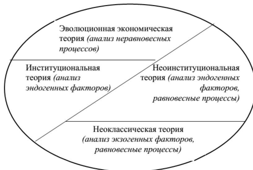
Рис. 2. Массив современных направлений экономической мысли

Для нас важно не столько разграничение теорий, выстраивание связей соподчинения между ними, сколько то, в какой мере те или иные школы экономической теории могут быть использованы для анализа трудовых отношений и происходящих в них в настоящее время изменений.