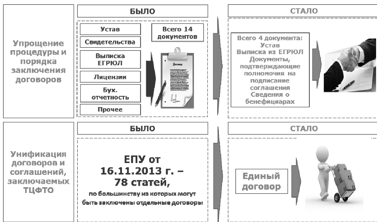
Рис. 2. Схема управления доставкой грузов [6, 8]

Использование принципа «одного окна» позволяет транспортной компании предлагать коммерческие варианты транспортировки груза, заключать единый договор, исключая дублирование функций более мелкими структурными подразделениями, упрощает систему оплаты. На рисунке 2 приведена схема работы ОАО «РЖД» в Алтайском крае.