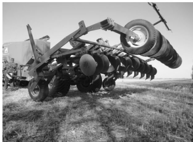
Рис. 1. Комбинированная почвообрабатывающая машина-орудие для полосовой обработки почвы производства компании Амазоне

четы различных составов агрегатов, где в качестве варьируемых факторов приняты рабочая скорость движения МТА (3 уровня) и глубина обработки почвы (4 уровня). Выходными показателями являлись значения чистой производительности МТА на базе трактора К-744Р1 и расхода топлива на единицу обработанной площади. Критерием оптимизации была величина эксплуатационных затрат на обработку почвы.