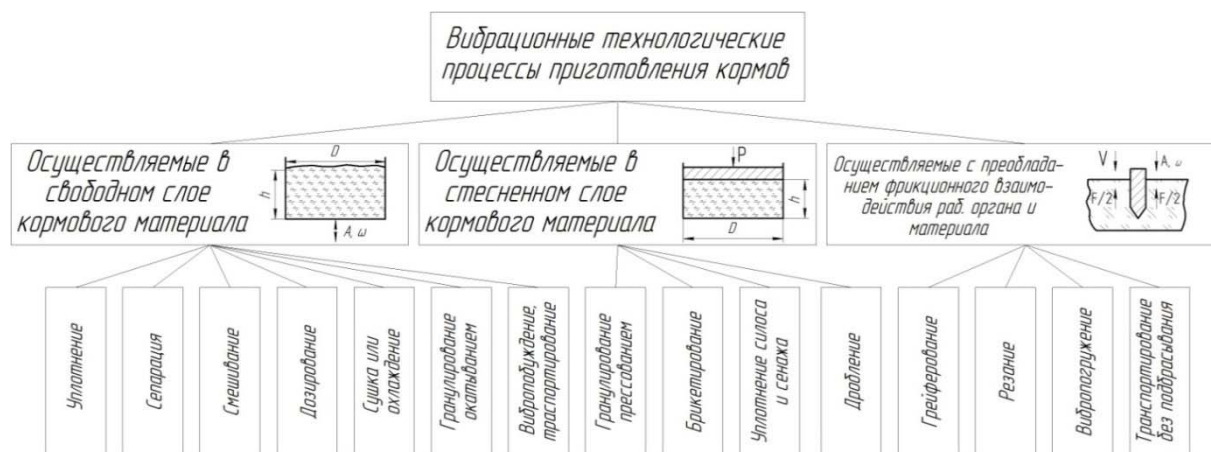
Рис. 2. Классификация вибрационных технологических процессов приготовления кормов

В отдельную группу выделены также процессы, главные взаимодействия которых протекают в зоне фрикционного взаимодействия исполнительного органа и рабочей среды. Процессы распространения вибраций в толщу материала, возникновение циркуляционных потоков частиц и т.д. здесь либо не возникают, либо не имеют существенного значения. В этом случае обрабатываемый материал можно моделировать сплошным твердым телом или представлять совокупностью отдельно движущихся частиц. Главная отличительная особенность этой группы процессов – существенная роль явления вибрационного преобразования внешнего трения.