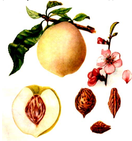
Рис. 4. Аг назлы

Форма ценится для приготовления компотов, а также для потребления в свежем виде.