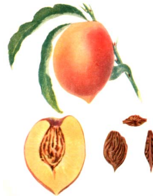
Рис. 1. Зафрани ранний

и для приготовления компотов. Распространена в Ордубадском и Бабекском районах.