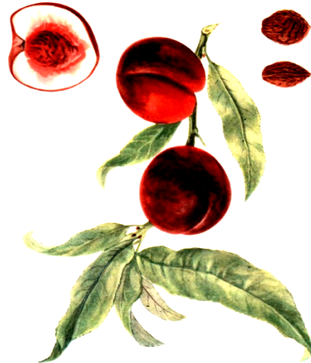
Рис. 5. Шарали красный

оранжевая или кремовая, приятно кисло-сладкая, ароматная, сжатая с боков, оканчивается щипом средней длины, покрыта немногочисленными мелкими ямочками и желобками. Цвет светло-коричневый. Форма урожайная, с одного дерева снимают 135-152 кг. Созревание начинается с третьей декады августа и продолжается до середины сентября. Ценится для употребления в свежем виде и для приготовления компотов.