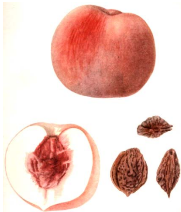
Рис. 2. Салами

Летние. Плоды этой группы сортов и форм созревают с августа до второй половины сентября. К ним относятся Кетам-10, Гильанчай-9, Ордубад-60, Зейнадин-70, Ташарх-74.