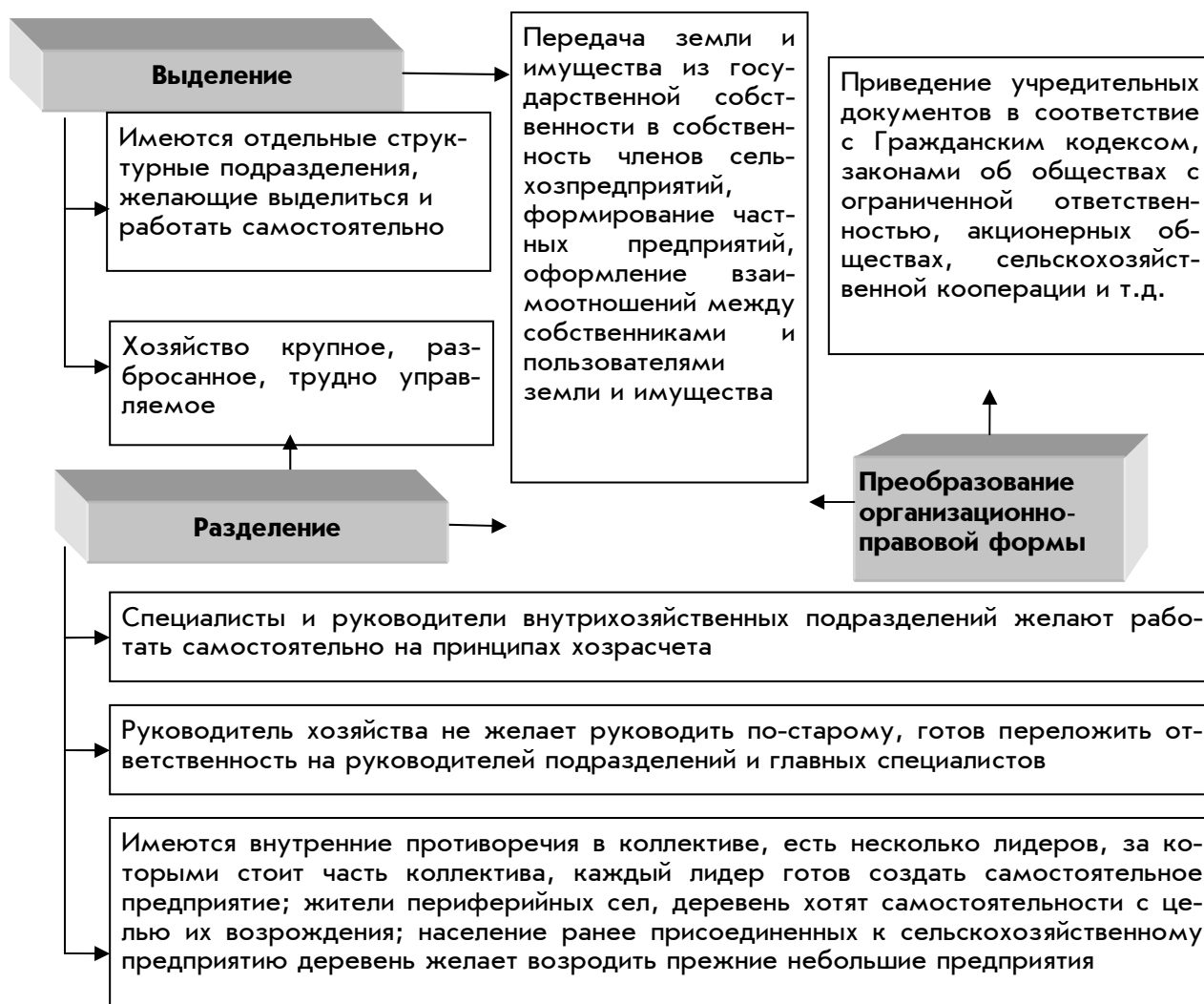
Рис. 3. Необходимость, мотивы и варианты реформирования сельскохозяйственных предприятий