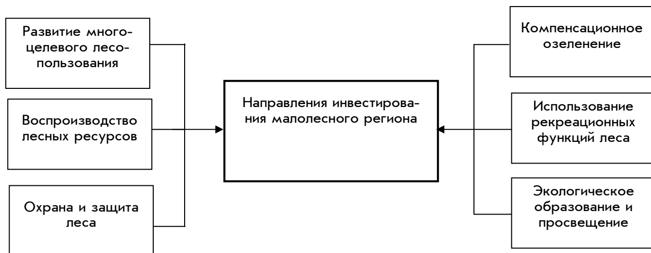
Рис. 1. Направления инвестирования малолесного региона

- лесоохранные, лесовосстановительные инвестиции и во времени в пространстве должны осуществляться с учетом саморегулирующей, самовосстанавливающей способности экосистем, отдельных ее компонентов. Это обусловлено тем, что человеческим трудом воссоздать то, что создает природная среда, полностью невозможно;