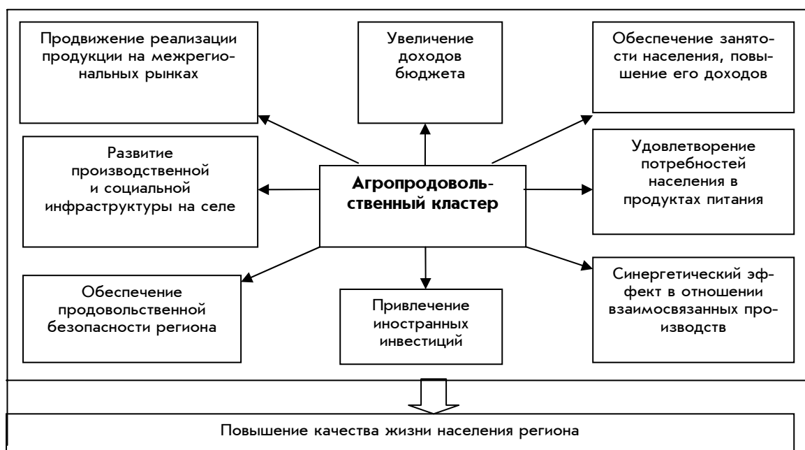
Рис. 2. Влияние агропродовольственного кластера на социально-экономическую ситуацию региона