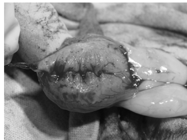
Рис. 3. Традиционный двухрядный шов, наложенный на операционную рану мочевого пузыря у кошки

Интраоперационно и в послеоперационный период проводили клинические, гематологические, гистологические, бактериологические, ультразвуковые исследования и пневмопрессию [5].