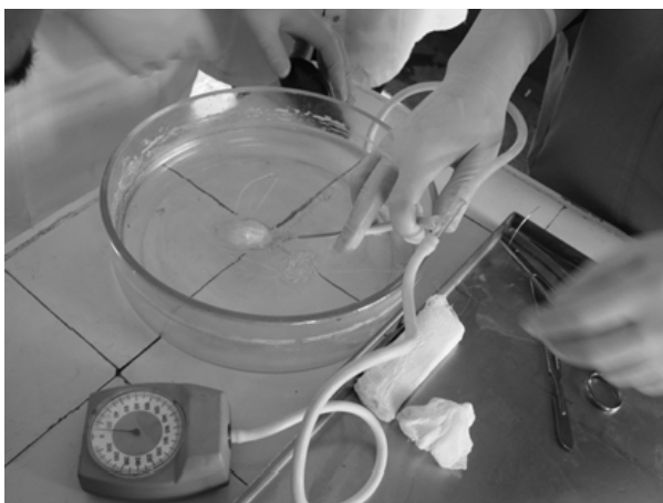
Рис. 4. Проведение пневмопрессии на патматериале

лено следующее. «Бесшовное» соединение тканей мочевого пузыря сразу после склеивания выдерживало давление 80-110 мм рт.ст. После выполнения шовно-клеевой композиции давление воздуха в мочевом пузыре доводили до 100-120 мм рт.ст. При использовании традиционного двухрядного шва физическая герметичность изменялась в пределах 60 мм рт.ст.