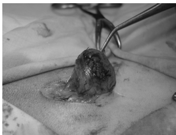
Рис. 2. Шовно-клеевое закрытие операционной раны мочевого пузыря у кошки