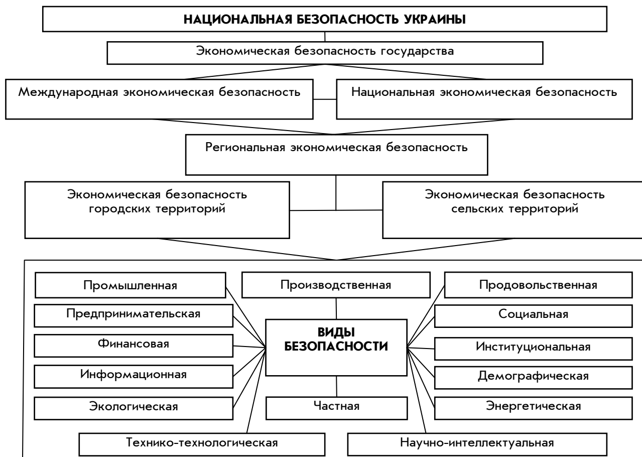
Рис. 2. Структура экономической безопасности государства

Преимущества в предложенном территориально-административном подходе разделения экономической безопасности на два принципиально новые подвиды: экономическую безопасность сельских и городских территорий можно воплотить путем активизации ее как особой функции для всех ветвей государственной власти (от сельской головы до губернаторов, мэров мегаполисов и министров). Такое разделение также упростит задачу предупреждения, частичной локализации или полного устранения внутренних и внешних угроз и конфликтов. Очевидно, что процесс формирования механизмов регулирования и идентификации уровня экономической безопасности четко определенной территории – более простая задача, чем создание общей методики определения экономической безопасности государства. Более естественным путем, по мнению автора, является использование конкретно-индуктивного метода, когда, собирая информацию из сельских и городских районов, затем ее обобщают в пределах региона, а результаты соответствующих показателей региональной экономической безопасности непосредственно создадут интегральный показатель экономической безопасности государства. Таким образом, двигаясь «снизу вверх», автоматически удовлетворятся интересы большинства населения Украины.