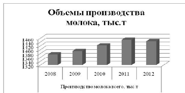
Рис. 1. Объемы производства молока в Алтайском крае за период 2008-2012 гг.

По данным Алтайкрайстата за 2012 г. поголовье коров сократилось на 11,3 тыс. по сравнению с показателями 2011 г. (рис. 2) [4]. Причина снижения поголовья коров банальна – нехватка кормов.