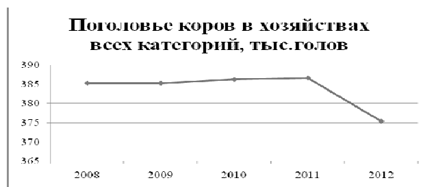
Рис. 2. Поголовье коров в хозяйствах всех категорий в Алтайском крае за период 2008-2012 гг.

Таким образом, одна из основных проблем, с которой сталкивается молочная про-