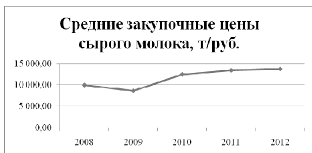
Рис. 4. Средние закупочные цены на сырое молоко в Алтайском крае за 2008-2012 гг., руб/кг