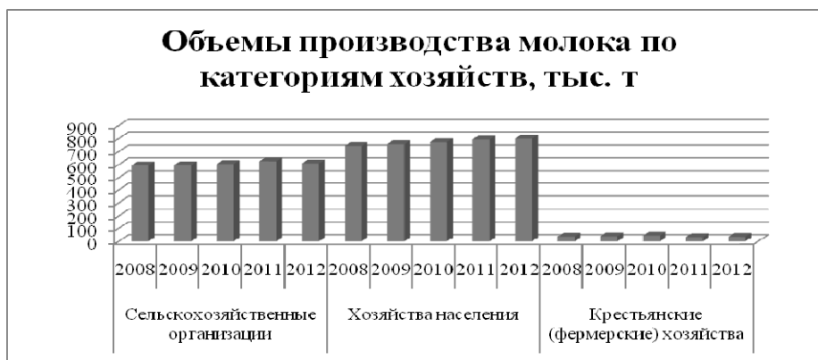
Рис. 3. Производство молока по категориям хозяйств в Алтайском крае за период 2008-2012 гг.