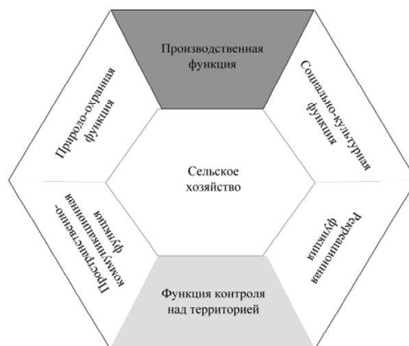
Рис. 1. Концепция «народно-хозяйственных функций села»

социально-духовных и рекреационных потребностей общества [1].