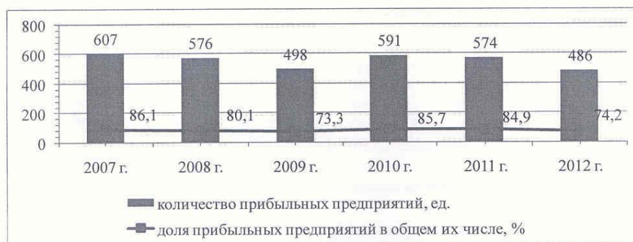
Рис. 1. Количество прибыльных хозяйств и их доля в общем числе сельскохозяйственных предприятий Алтайского края