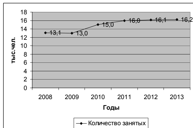
Рис. 2. Динамика роста общего количества занятых в сфере туризма

В настоящий момент в крае функционируют 900 туристских предприятий, из которых около 562 единицы – коллективные средства размещения и «зеленые» дома. Путевки в Алтайском крае реализуют около 250 туристских фирм, 45 из них имеют статус туроператоров. Количество мест размещения выросло до 47,4 тыс., в т.ч. круглогодичных – 16,6 тыс. Отдых туристов обеспечивают 182 гостиницы, 44 санаторно-курортных учреждения, в том числе 8 детских санаторно-курортных организаций, 150 турбаз и баз отдыха. В 2013 г. инвестиции в основной капитал средств размещения края составили 2,6 млрд руб., в т.ч. из внебюджетных источников – 2 млрд руб. [5].