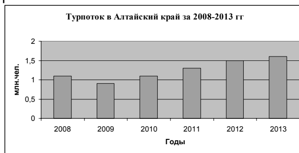
Рис. 1. Динамика роста туристского потока

районы). Общая протяженность маршрута – около 295 км. Трансграничный маршрут «Большое Золотое кольцо Алтая», протяженностью 1,5 тыс. км свяжет Восточно-Казахстанскую область Республики Казахстан, предгорья, степную часть Алтайского края (всего девять городов и 47 районов края) и Кузбасс. В туристский маршрут войдет и Мемориальный музей, посвященный конструктору стрелкового оружия Михаилу Калашникову, в селе Курья, где представлена не только деятельность известного земляка, но и планируется создание конструкторского бюро, где любой желающий с помощью современных компьютерных программ сможет почувствовать себя настоящим конструктором.