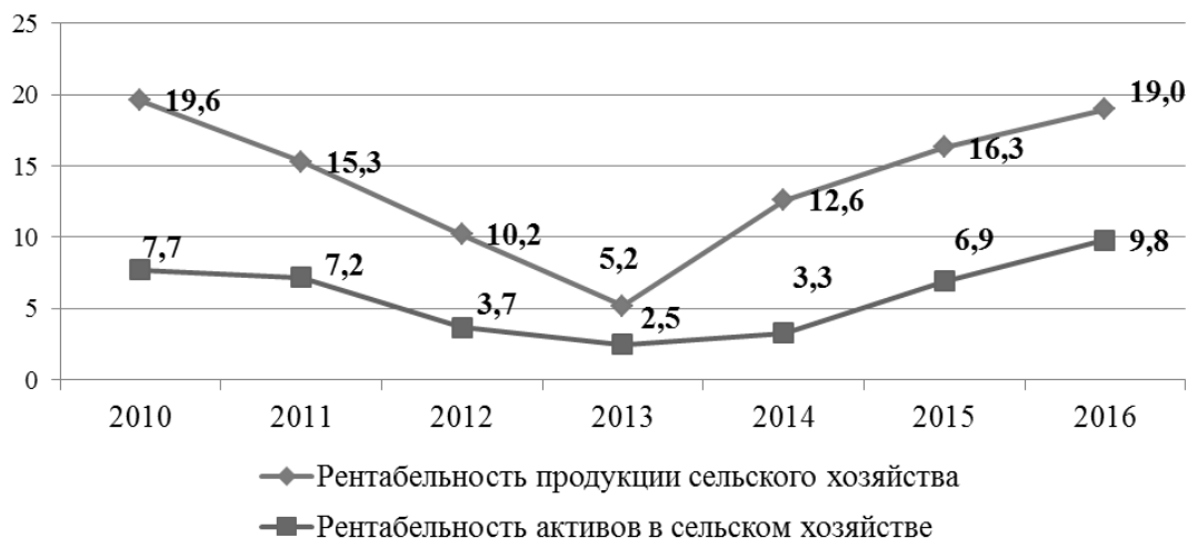
Рис. 3. Доходность сельскохозяйственной отрасли Алтайского края