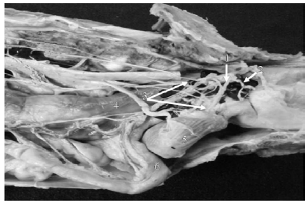
Рис. 3. Зона распространения окрашенного раствора, введенного оперативным доступом для внутриоперационной блокады тазового сплетения (фото с макропрепарата): 1 – тазовый нерв; 2 – срамной нерв; 3 – экстраорганные нервы краниального и каудального отделов мочепузырнополовой части тазового сплетения; 4 – прямая кишка; 5 – мочевого пузырь; 6 – матка

При использовании предлагаемого способа оперативного доступа в эксперименте окрашенный раствор латекса коагулировал на всей площади локализации тазового сплетения, пропитывая околонервную рыхлую волокнистую соединительную ткань по всему объему, на уровне от середины тела седьмого поясничного позвонка до второго хвостового. В проекции этих сегментов раствор распространялся в околоорганной области тела, шейки матки и влагалища, также каудальной трети тела мочевого пузыря и его шейки, пропитывая рыхлую волокнистую соединительную ткань в зоне расположения нервных узлов обеих частей сплетения, выходящих из них нервов, а также отдельных нервных проводников, формирующих экстраорганные сплетения органов тазовой полости (рис. 3).