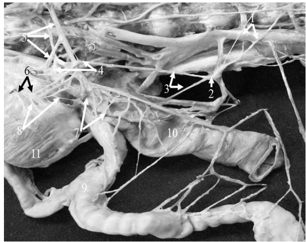
Рис. 1. Тазовое сплетение и источники его формирования (справа) у собаки домашней: 1 – поясничные внутренностные нервы; 2 – каудальный брыжеечный узел; 3 – подчревные нервы; 4 – нервные узлы тазового сплетения; 5 – тазовые нервы; 6 – ветви срамного нерва; 7 – нервы прямокишечной части тазового сплетения; 8 – нервы мочепузырнополовой части тазового сплетения; 9 – матка; 10 – прямая кишка; 11 – мочевого пузырь

Двуслойная пространственная организация тазового сплетения обеспечивается соединительнотканым каркасом, состоящим из рыхлой волокнистой соединительной ткани, основное вещество которого содержит большое количество взаимопереплетающихся коллагеновых и эластических волокон и содержит объемные включения жировой ткани, составляющие до 2/3 объема соединительнотканного слоя. Развитость соединительнотканной капсулы вокруг нервных элементов тазового сплетения так же, как и их изоляция, жировой тканью, требует адресной доставки растворов анестетиков к нервам сплетения в необходимом объеме. Последнее обстоятельство не является препятствием, так как в окружающей сплетение рыхлой волокнистой соединительной ткани много эластических волокон, позволяющих тканям восстанавливать пространственную организацию после депонирования и резорбции жидкостей.