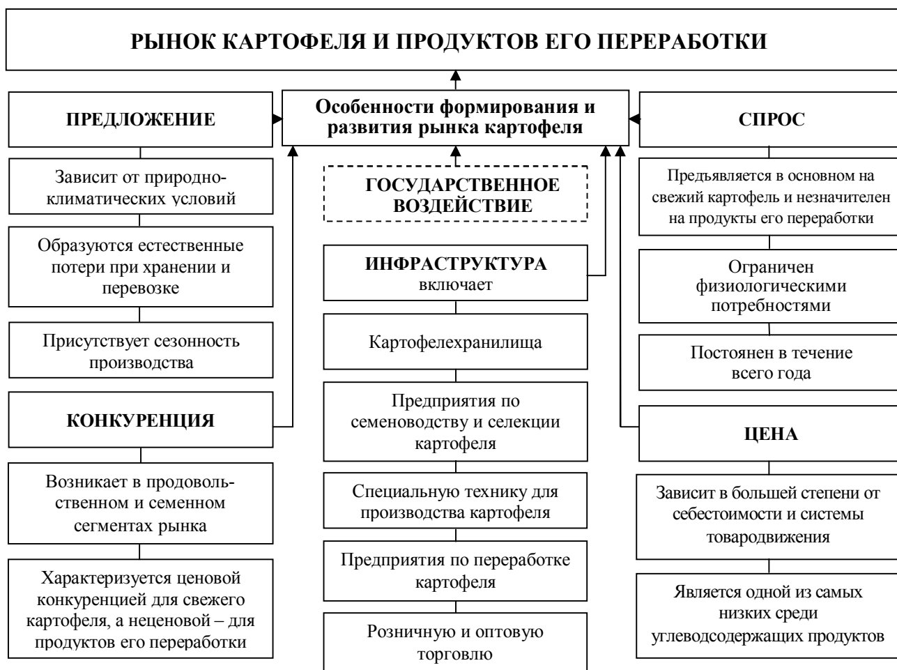
Рисунок 1 – Особенности формирования и развития рынка картофеля

и продуктов его переработки функционирует и развивается по определенным экономическим законам, но при этом имеет свои особенности(рисунок 1).