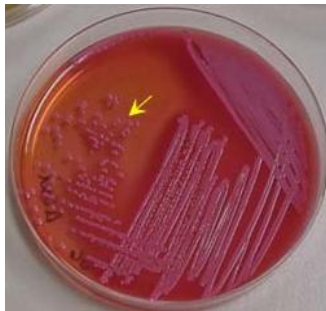
Рисунок 1 – Колонии E. coli на плотной питательной среде показаны стрелкой

Глоссарий ВКР должен содержать 10 – 15 основных понятий и терминов, используемых в контексте исследуемой проблемы.